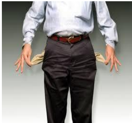
...das wird passieren