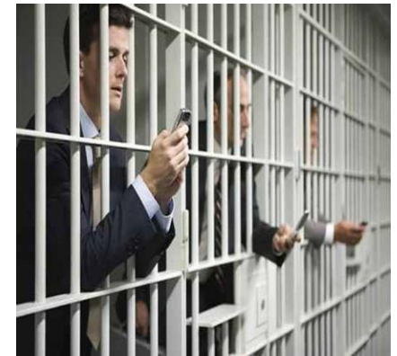
...das könnte passieren